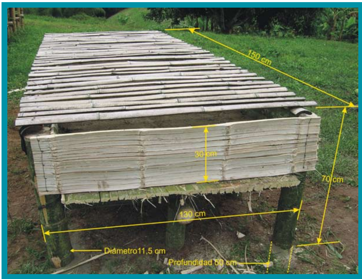
Figura 2. Medidas recomendadas en la construcción de un germinador de café.

gravilla de 1 cm de profundidad, para proporcionarle un buen drenaje al germinador. Luego se ubica una capa de arena fina de río cernida (arena de revoque), con el fin de quitar las piedras e impurezas de mayor tamaño que puedan interferir con la germinación de la semilla. Es importante que la capa de arena tenga 20 cm de profundidad, para que el fósforo o la chapola de café disponga del espacio apropiado para su desarrollo radical. Aproximadamente, se necesitan 140 kg de arena para cubrir un metro de germinador. En la parte superior de éste debe colocarse un tendido de latas de guadua a manera de tapa, para darle soporte a los costales para favorecer las condiciones de germinación de las semillas y proteger el material ya germinado de los rayos del sol.