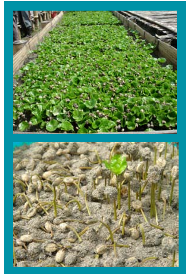
Figura 4. Chapolas de café producidas en la Subestación Experimental La Catalina y en una Finca particular, en un sustrato tratado con T. harzianum (arriba) y sin tratar (abajo).